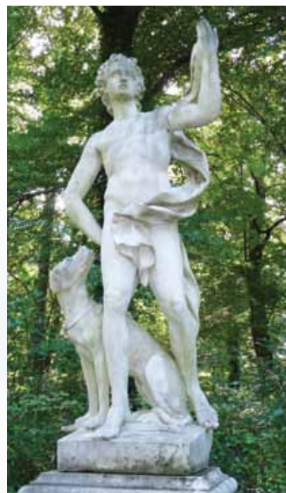
Apolon s psom

Spremljaj me na zadnji poti. Ne reci »Tega ne morem gledati« ali »Naj se zgodi v moji odsotnosti«. Veš, s tabo mi je vse veliko lažje.