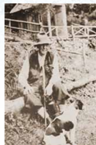
Pisatelj Fran Saleški Finžgar z Liskom