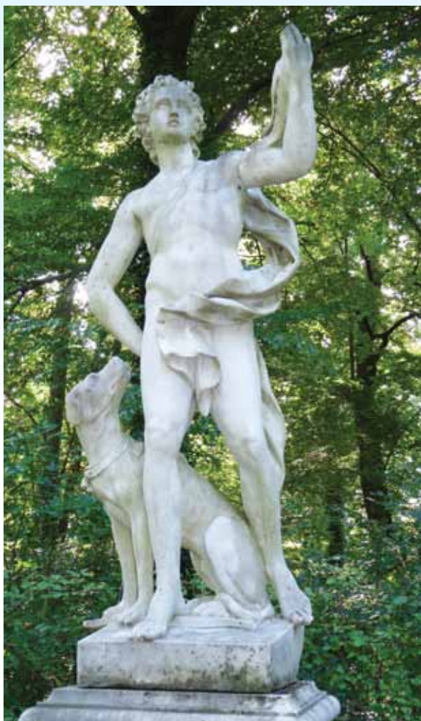
Apolon s psom